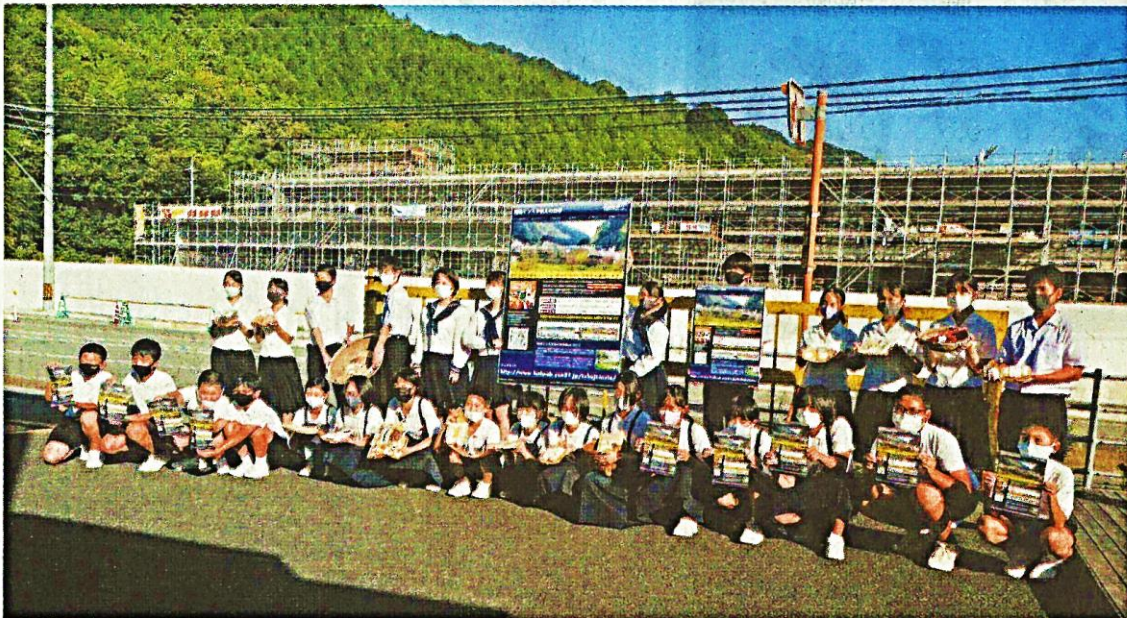
写真の応募を呼び掛ける児童・生徒（防長交通堀駐在で）

は「全国に徳地を発信するのが目的。自分も市中心部から通学して2年になるが、川の音、朝の空は「全国に徳地を発信する気が、鳥の鳴き声など自然が豊かで魅力にあふれている。実際に来て、感じてほしい。若い世代にも入ってきてもらいたい地域が活気つけば」と語った。防長交通堀駐在の大看板は道路に面しており、向かい側の施設はもちろん、歩行者やドライバーからもよく見える。